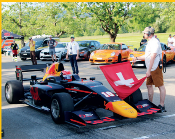
Fahrer aus der ganzen Schweiz werden mit schnellen Rennsportwagen am Start erwartet.

Bewährt hatte sich 2022 auch die Entscheidung der veranstaltenden ACS Sektion Thurgau, dem Publikum an beiden Renntagen freien Zutritt zu gewähren. Die Besucherinnen und Besucher dürfen sich in den ausgeschilderten Zuschauerzonen ebenso